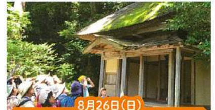
8月26日(日) 知ろう・～国上山の自然・歴史・文化

集合場所 燕市分水ビジターサービスセンター 【内容】 他の地域には無い魅力を知り、未来へのあるべき姿を思いましょう。