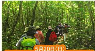
5月20日(日) 触れよう・～木々の優しさ

【コース】ビジターサービスセンター→ちご道 出合い⇒こもれび広場⇒紅葉広場(仮称)⇒朝 日山展望台⇒ビジターサービスセンター