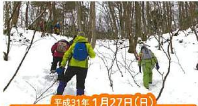
平成31年 1月27日(日) 体験しよう・～冬山の楽しみ方

【コース】ビジターサービスセンター⇒紅葉の 谷(折り返し)⇒幸八山展望処(折り返し)⇒ビ ジターサービスセンター