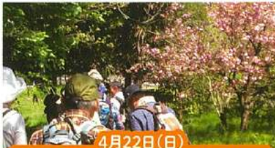
4月22日(日) 守ろう・～花の国上山

集合場所 燕市分水ビジターサービスセンター 【内容】 花の国上山に自生する貴重な山野草を鑑賞し、守る大切さと難しさを知りましょう。