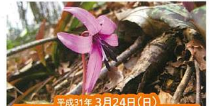
平成31年 3月24日(日) 学ぼう・～未来?の国上山

【コース】道の駅国上⇒酒呑童子神社⇒酒呑童 子神社分岐を左⇒任意の林内を自由散策⇒酒 呑童子神社⇒道の駅国上