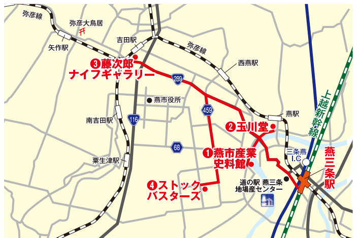
※ ルートは当日の天候や交通状況等によって変更する場合があります。